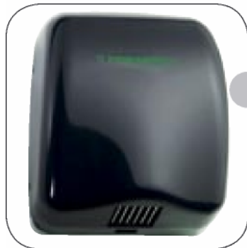
NATUS 26 (a)