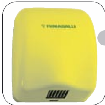
NATUS 27 (g)