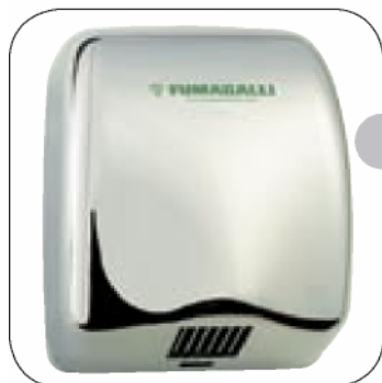
NATUS 24 (l)